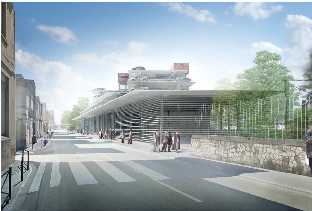
Hall Belcier - Vue depuis la rue des terres de bordes (parking et velostation)