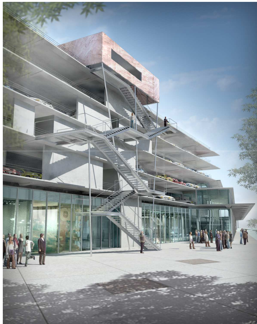
Hall Belcier - Vue de l'entrée, depuis le parvis