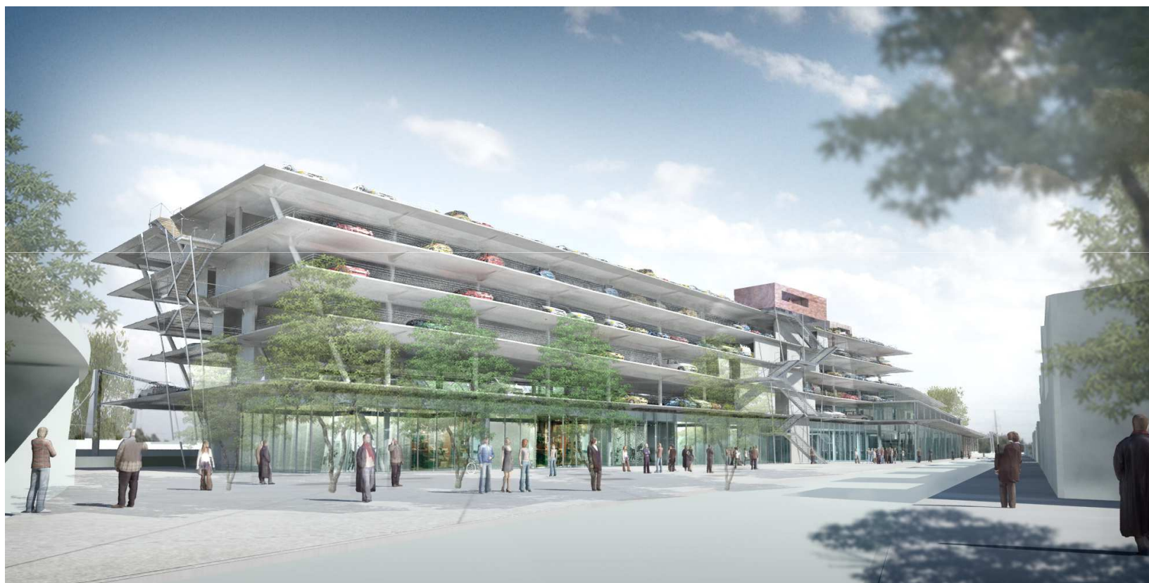
© AREP/SNCF Gares & Connexions - Hall Belcier - Vue du parvis