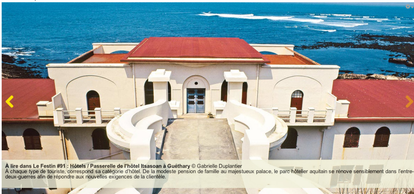
À lire dans Le Festin #91 : Hôtels / Passerelle de l'hôtel Itsasoan à Guéthary À chaque type de touriste, correspond sa catégorie d'hôtel. De la modeste pension de famille au majestueux palace, le parc hôtelier aquitain se rénove sensiblement dans l'entre-deux-guerres afin de répondre aux nouvelles exigences de la clientèle.