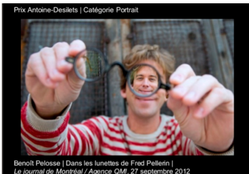
Photo gagnante 2012 dans la catégorie Portrait

Appel de candidatures Prix Antoine-Desilets 2013